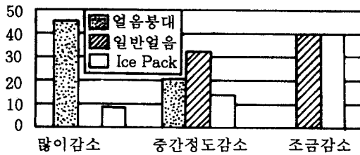
그림 2. 뽕윤(부종)에 대한 도구별 치료효과 비교 (%)