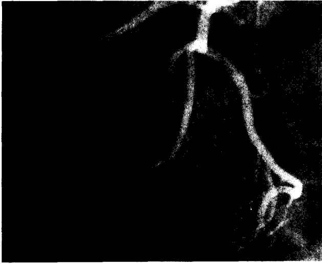
Fig. 1. Preoperative coronary angiography showing irregular stenosis of the proximal LAD by 95% luminal narrowing