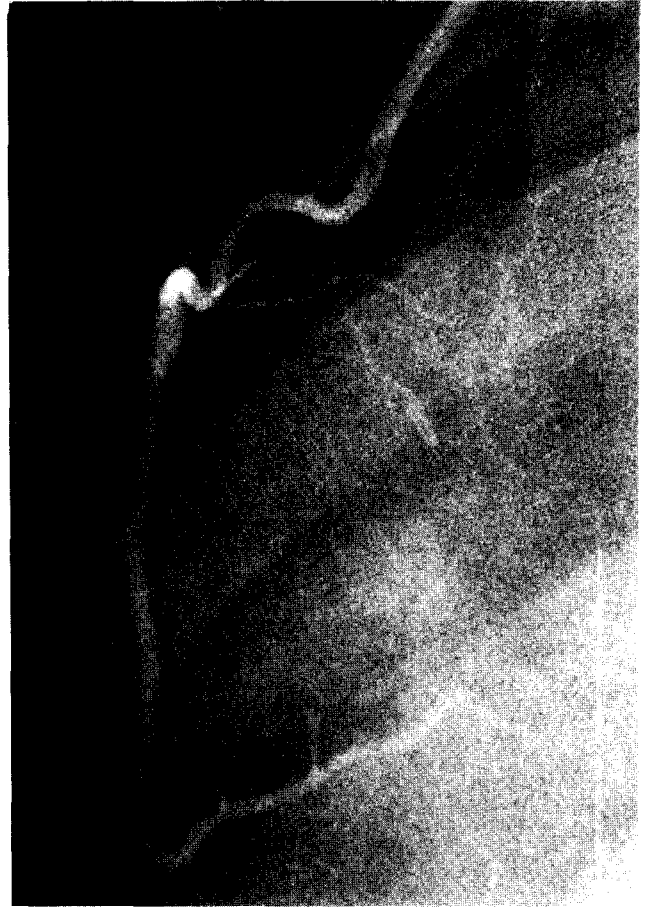
Fig. 4. Postoperative coronary angiography showing good flow and perfect anastomosis between LIMA and LAD

문합시간은 10분이었으며 총 수술시간은 2시간 30분이었다. 환자는 수술장에서 기관삽관을 제거할 수 있었으며 수술 후 합병증없이 좋은 경과를 보였다. 술후 제 7일에 시