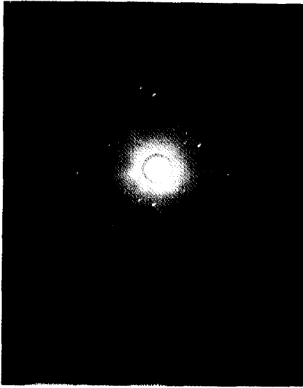
Fig. 2. X-ray back-reflection Laue pattern of the original [111] Platinum striated seed (99.999%). The incident direction of the X-ray was perpendicular to the [111] Pt seed wire.