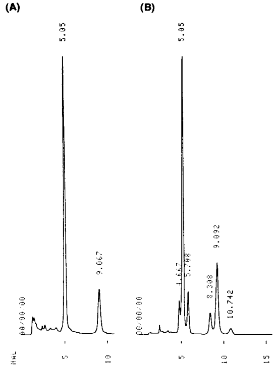
Fig. 1. HPLC chromatogram of Monascus yellow pigments at the /YMA media(A) and MEA media(B).

색소를 분취용 컬럼으로 정제하여 화학구조를 규명하였다. EI-MS spectrum에서 2개 황색색소는 m/e=162의 base peak와 358의 molecular ion peak(M + ) 또는 386의 molecular ion peak(M + )를 나타냈다. Base peak는 monascin이 retro-Diels-Alder 분해반응으로 생성된 cyclohexenone으로 추정된다. 5분대의 황색색소는 분자량이 358인 monascin(C 21 H 26 O 5 )으로, 8분대의 황색색소는 분자량이 386인 ankaflavin(C 23 H 30 O 5 )으로 추정하였다. 5분과 9분대의 2개 황색색소에 대한 H 1 and C 13 NMR spectrum의 chemical shift 값(δ)을 Table 3에 나타냈다. 이상의 결과에서 5분(I)과 9분(II)대의 2개 황색색소는 각각 monascin과 ankaflavin으로 확인하였다.