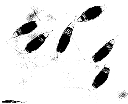
Fig. 1. Photomicrograph of Spore Apparatus of Pestalotiopsis sp. KCTC 8637P ( \times 1,200 ).

주를 분리하여 형태학적인 특징 및 포자의 형태를 관찰하였다. 곰팡이의 분류에서 가장 중요한 요소인 포자형성군의 포자에 대한 형태학적인 특성을 조사한 결과를 Table 1에 나타내었고, Fig. 1은 분리균주의 포자를 광학현미경으로 관찰한 것으로, 분리 균주의 포자형태는 격막이 4개 있고, 축수가 3~4개 이며, 전체적으로 고동색을 띄는 것이 가장 큰 특징으로 나타났다. 이상의 결과를 볼