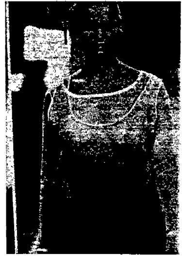
〈그림 6〉 Joe Casely-Hayford '91 P/L, S/S, Collection, p. 318.