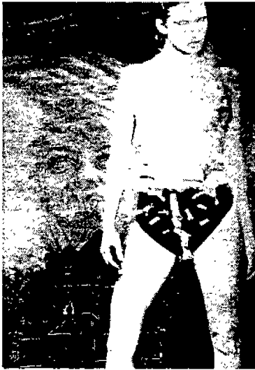
〈그림 4〉 Moda In N. 97, p. 111

대표적 디자이너로는 Hermés, Enrico Coveri, Joe Casely-Hayford, Romeo Gigli, J. C. De Castelbajac, Jean-Paul Gaultier, Kimijima 등이 있다.