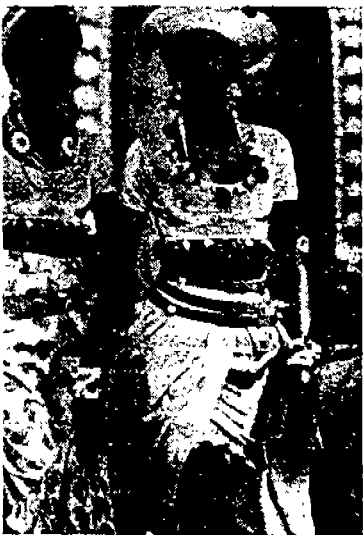
〈그림 2〉 Chantal Thomas '90 Collection, Paris-25.