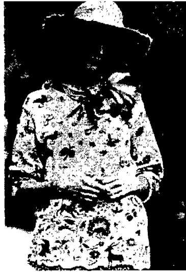
〈그림 3〉 Kenzo Takada '92 Collection, Paris-15.