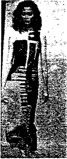
〈그림 10〉 Yuji Yamada '93 N. Y/T. K, S/S, Collection, p. 67.