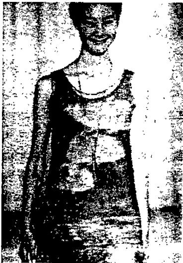
〈그림 5〉 Tsumori Chisato '95 N. Y/T. K/Seoul, S/S, Collection, p. 156.