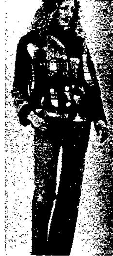
〈그림 11〉 Moschino '93, 94 Milan/Madrid, A/W, Collection, p. 120.

재활용의 의미로 대두된 패치워크는 캐주얼에서 포멀한 의복까지 폭넓게 사용되고 있으며 이질적인 소재의 혼합(Mix Match)과 프린트물을 다양하게 조화시켜 세련된 모습을 표현해 준다.