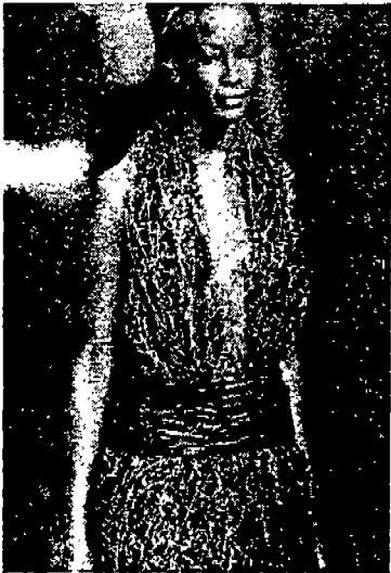
<그림 8> Romeo Gigli '95 P/L, S/S, Collection, p. 166.