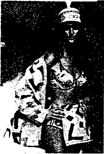
<그림 7> Chantal Thomas '92 P/L, S/S, Collection, p. 263.