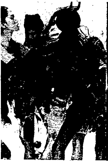
〈그림 1〉 Thierry Mugler '89 Gap(Collection), Paris-8