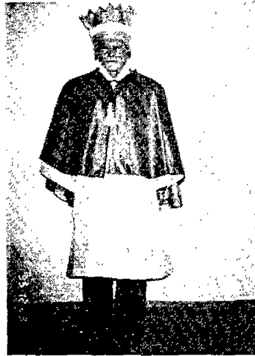
(圖 1) 미륵불교 의례복식을 착용한 알 모습

이와 같이 의복을 제 2의 피부로 인식하고 儀禮服에 우주의 이치를 담아 외형을 통하여 인간의 내면을 다스리고자 했던 創敎主의 복식에 대한 인식이 그들의 經典에 잘 나타나 있다. 아울러 의복이라는 외적인 수단을 통하여 思想을 전달하고자 한 바는 현재의 儀禮服飾의 명칭과 형태를 통하여 구체적으로 표현되고 있다.