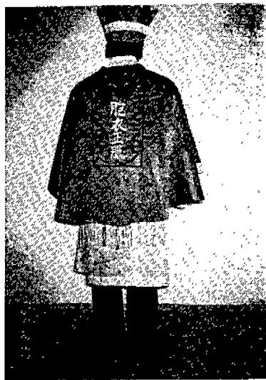
(圖 2) 미륵불교 의례복식을 착용한 뒷 모습