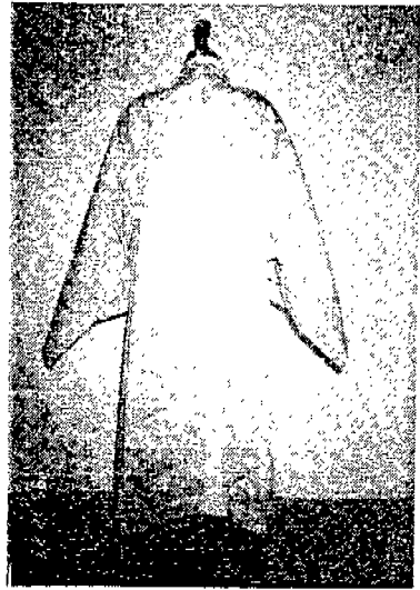
(圖 4) 正 服

正服은 天·地·人 중에서 天과 父·母·人에서 父를 상징하며 道의 本體服이며 法服의 主體服이다. 仙·佛·儒중 仙敎의 개념을 상징하는 正服