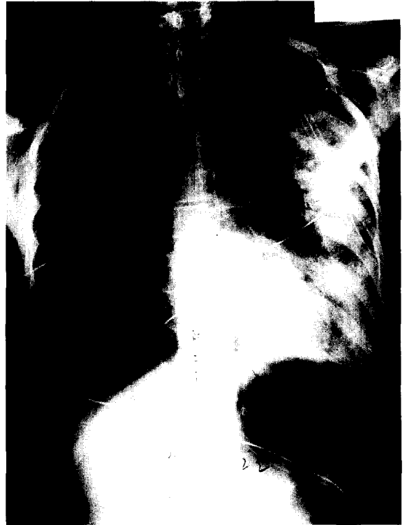
그림 2. 흉관삽관직후의 단순흉부사진

전되어 24시간 후 동맥혈 가스분석에서 저산소증과 산중은 교정되었다. 공기누출이 10일간 계속되어 쇠기형 폐절제수술을 시행받고 입원 21일째되는날 퇴원하였다.