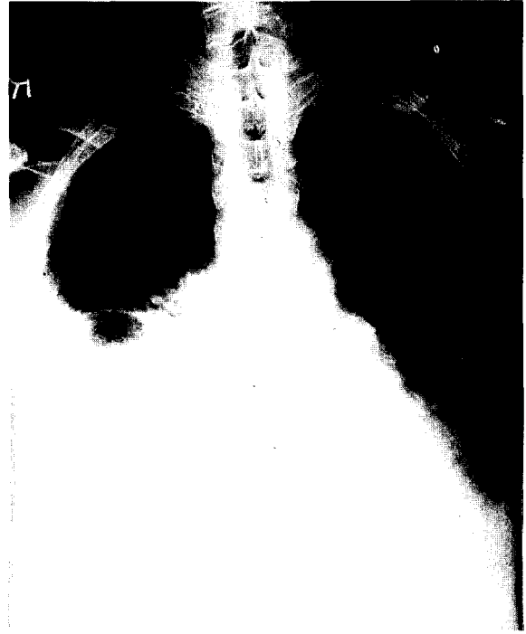
그림 4. 흉관삽관직전의 단순흉부사진

청진 소견상 우측폐 전체에서 나음이 청진되었다. 동맥혈 가스분석상 좀더 심해진 저산소증(pH:7.35, Pco 2 : 32, Po 2 : 49, Base Excess: -5.8, O 2 saturation: 83%)의 소견을 나타내었고 단순흉부촬영상 우측폐에 일측성으로 폐부종이 발생한 것을 볼 수 있었다(그림 5). 즉시 산소마스크를 통해 고농도의 산소를 주입하면서 생리식염수를 투여하고 강심제(dopamine)를 투여 하였으나 증세 호전없이 수축기 혈압 50mmHg 이하 저혈압이 지속되어 폐쇄식 흉관삽관술 시행 12시간 후 사망하였다.