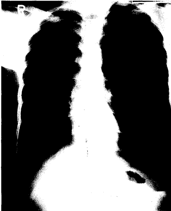
그림 1. 내원시의 단순흉부사진