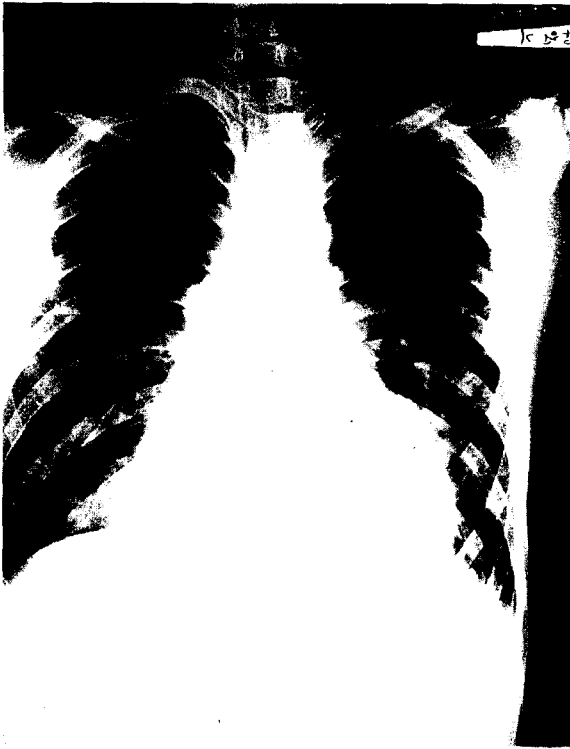
그림 1. Preoperative chest x-ray

흉부 단순X선 소견상 좌측 폐하부에 peribronchovascular infiltration 소견있었으나 심비대의 소견은 없었다(그림 1).