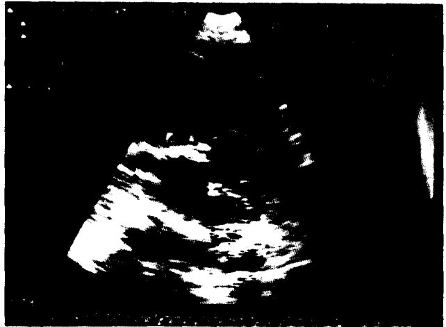
그림 3. Preoperative echocardiography

과 amikacin을 사용하였고, 술후 3일째 WBC 8,700/mm 3 으로 정상화되었다.