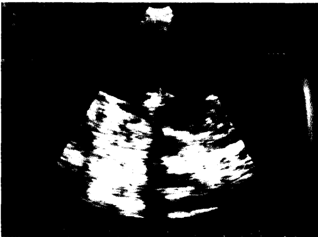
그림 4. Postoperative echocardiography

균중 연쇄상구균은 아급성의 병변을 일으키고, 포도상구균은 급성병변을 일으키는 것으로 알려져 있다. Zakrzewski 등 1) 은 소아에서 1:2,000 미만의 빈도로 감염성 심내막염이 생긴다고 하였고, 최근의 빈도는 1:4,500~1:2,700 정도인 것으로 보고되고 있다. Weinstein과 Rubin 2) 은 감염성 심내막염 환자의 평균 연령은 34세라고 하였다. 그러나 1979년 Kaplan 등 3) 은 감염성 심내막염이 20세 미만에서 시작되는 경우가 20% 이상이고, 어느 연령층에서나 생길 수 있다고 보고하였다. Van Hare 등 4) 은 대부분의 환자에서 심혈관계의 병변, 특히 심장판막의 병변이 있지만 없는 경우도 17%나 된다고 보고하였다. 심내막염이 발생하는 기전에는 대부분 2가지 요건이 선행되는데, 첫번째는 혈류에 감염원이 있고, 둘째는 심혈관계에 선천성 혹은 후천성의 병변이 존재한다는 것이다. 혈류에 감염원이 생기게 되는 경우는 치과적 처치, 외과적 처치로 생기는 경우가 많고, 환자의 면역체계에 이상이 생겨 오는 경우도 있다. 심혈관계의 이상이 있는 경우 혈류의 와류가 생기게 되는 압력차가 있는 곳은 어디에서든지 증식증(vegetation)이 생길 수 있고, 심내막이나 혈관내막에 손상을 줄 수 있다. 이 손상부위에 혈소판과 섬유소가 침착하여 망상구조를 이루게 되고, 계속 커져서 혈전을 형성하게 된다. 이를 비세균성 심내막염이라고 한다. 이때 연쇄상구균 또는 포도상구균의 감염이 있게 되면 심내막염이 생기게 되고, 이로 인해 혈소판 침착이 더욱 증진된다. 또한 혈소판의 lysosomal granule이 분해효소와 활동성 단백질을 분비하여 심내막염의 진행과정을 가속화 시킨다. 실험적인 연구에서 망상구조에 혈류의 세균 감염원이 침착하면 압력차가 있는 원위부에 감염소가 생기게 된다는 보고가 있다. 임상증