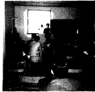
▲ 학술발표회장의 발표회 전경

넓직한 로비, 복도등이 대리석으로 깨끗하게 시설되어 있었으며, 야산둘레에 지어진 상경대학건물은 그야말로 자연속의 휴식공간 같은 아늑한 분위기로써 학술대회장으로는 아주 쾌적하고 훌륭한 장소였다고 생각되며 상경대학 신축완성후 우리학회가 처음으로 제일 큰 규모의 학술대회를 갖게 되었다고 한다. 오전 8시부터 시작되는 등록 준비 및 휴게실의 온수통 운반, 학술발표회장의 O.H.P 및 스크린 설치, 점검 등 이날 행사를 위하여 만반의 준비를 마쳤으며, 대강당 로비에 마련된 학회 등록장구에는 멀리 부산, 마산, 광주를 비롯하여 전국 각지의 회원들이 오전 8시 부터 모여들기 시작하여 당일 총 305명이 등록을 하였다.