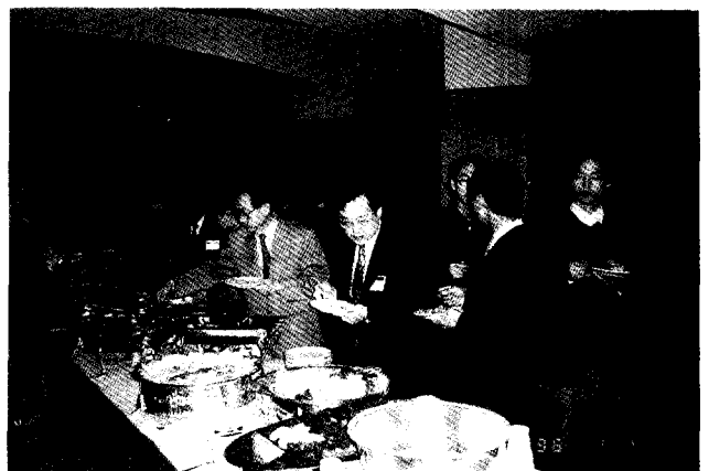
▲ 전야제(리셉션)에 참석한 회원들