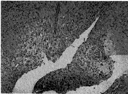
그림5. 25배 확대된 조직소견

진단되었다.(그림 3,4,5) 그러나 술후 2개월 후에 병소가 재발되어 재내원하였다.(그림 6) 재발의 원인을 고려해 봤을 때 병소하부치조골의 불안정한 제거로 판단되어 병소하부치조골의 완전한 제거를 포함한 종물의 절제술을