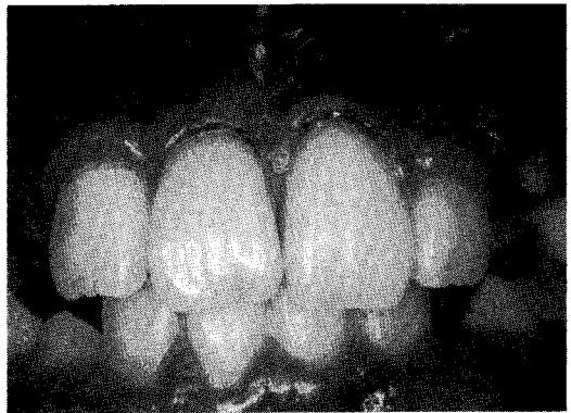
그림7. 재수술 4개월후의 구강내 모습

재시행하였다. 재수술후 4개월 동안 재발 소견은 보이지 않았다.(그림 7)