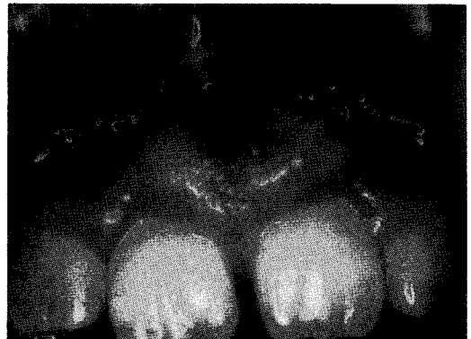
그림1. 초진시 구강내 소견

치료경과 및 결과 : 종물의 병리조직검사를 위하여 excisional biopsy를 실시하였다. 조직 검사결과 Peripheral odontogenic fibroma로