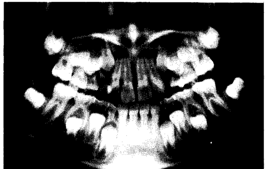
그림2. 초진시 방사선 소견