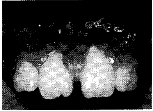
그림6. 술후 2개월후에 재발된 모습

진단되었다.(그림 3,4,5) 그러나 술후 2개월 후에 병소가 재발되어 재내원하였다.(그림 6) 재발의 원인을 고려해 봤을 때 병소하부치조골의 불안정한 제거로 판단되어 병소하부치조골의 완전한 제거를 포함한 종물의 절제술을