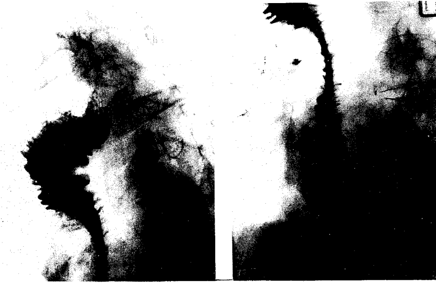
Fig. 3. Postoperative esophagogram shows no evidence of obstruction or passage disturbance (case 7).