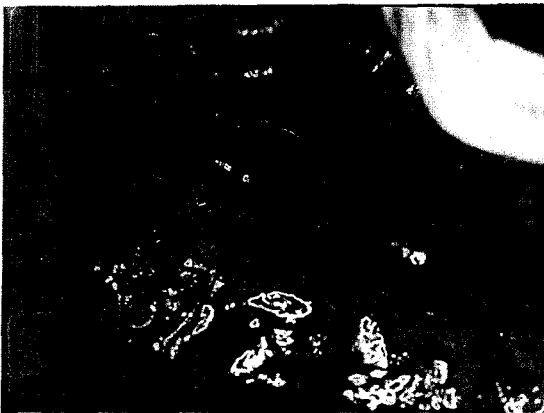
Fig. 2. The microvascular anastomosis was performed to the intercostal vessels (case 7).

도플러 혈류 측정과 식도 내시경을 병용하였으며, 늑간동정맥에 혈관문합을 한 경우는 식도내시경 소견에 의존하였다(Fig. 4). 술후 합병증으로는 이식편 괴사 1례(case 3)가 있었으며 수술 3일째 고열, 흉부X-ray상 증격동비후 소견을 보이고, 혈액검사상 백혈구수가 증가되고, 흉관을 통해 염증성 늑막액이 배액되어 괴사된 공장을 제거하였다. 상부식도는 식도루공을 좌측쇄골위에 만들었고 하부식도는 prolene 3-0으로 연속 봉합하였고 위루조성술을 시행하였다. 수술 결과 정맥문합부의 혈전(venous thrombosis)이 괴사의 원인으로 추정되었다. 환자는 식도 연결 수술을 기다리던 중 술후 6개월째 식