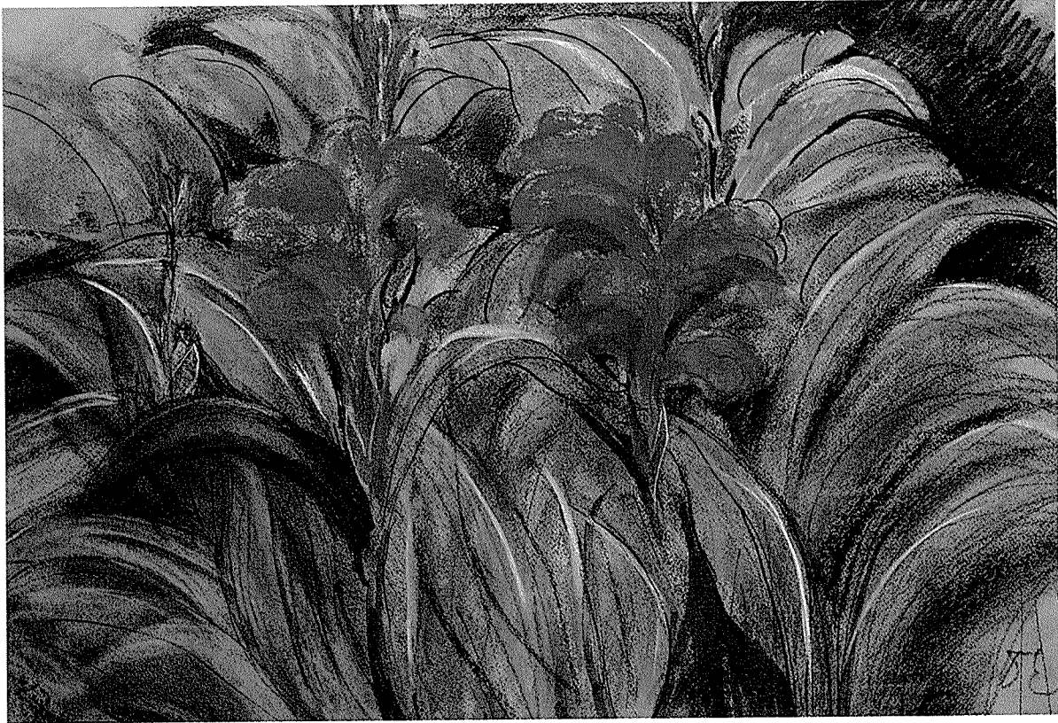
꽃 (45×65), 한창진 / (주) 한정건축종합건축사사무소

그림을 그려보고 싶은 생각을 할 수 있는 것만으로 다행이고 넉넉한 마음이다 스스로 찢개내지 않으면 얻을 수 없는 여유 손쉽게 파스텔로 이 것 저 것 그려보는 것 뿐인데 더 잘 그리고 싶은 연심이 날때는 혼자 웃는다. 거장 피카소가 그림이란 "진실에 도달하기 위한 거짓" 이라고 했대는가 ... 끝없이 진실에 도전하기 위한 거짓, -- 거창하다