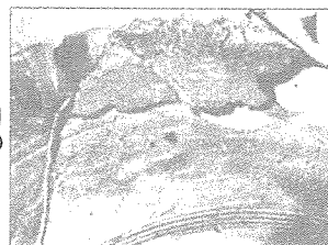
그림2 공기שמ에 의한 코드절단