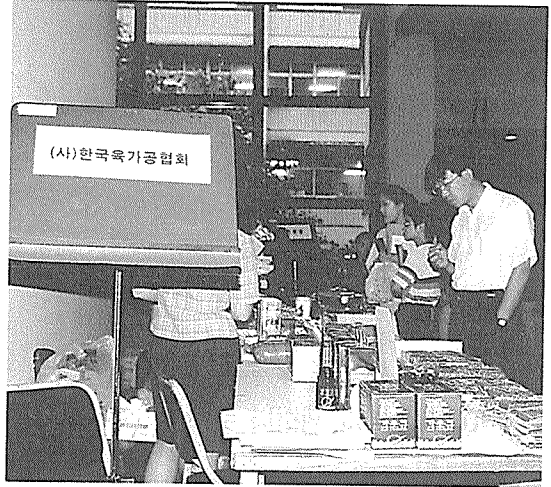
▲ 세미나장에서 육가공제품 홍보