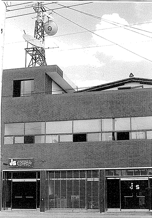
◀ 진성전자 회사전경