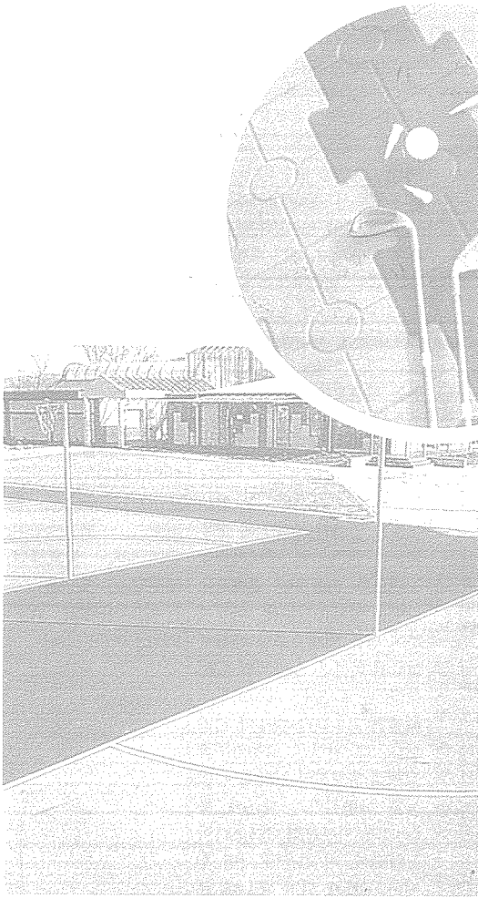
〈폐고무분말로 시공한 테니스코트장〉

페타이어와 폐고무를 분쇄하여 분말로 가공한 다음 접착과 착색과정을 거쳐 현장에 시공함으로써 기존의 우레탄코트에 비해 시설비가 저렴하고 반발탄성이 우수하여 무릎관절을 보호하는 등의 장점때문에 보급이 확대되고 있다.