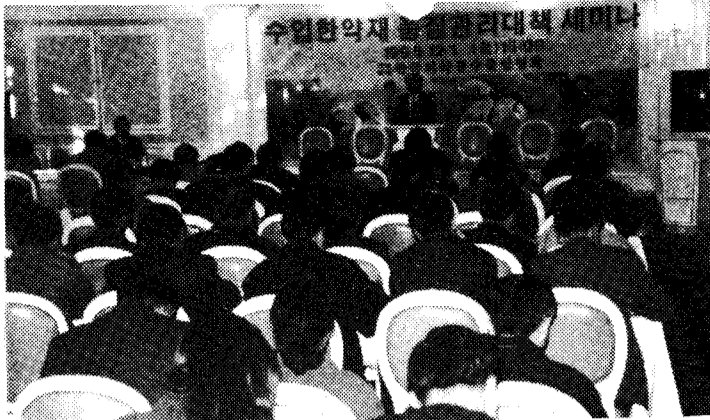
◇의약품수출입협회는 12월1일 수입한약재 품질관리대책 세미나를 개최했다.

시험대상 품목으로 중금속 함유기준을 강화하고 잔류농약 허용기준을 설정하고 시험대상 품목으로