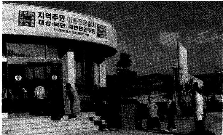
지역주민 무료진료(한국전력공사 한일병원)

소득증대사업 및 육영사업의 비율을 보면, 소득증대사업은 30.8%에서 37.0%로 증가하였으며, 육영사업은 21.9%에서 26.6%로 증가하였다.