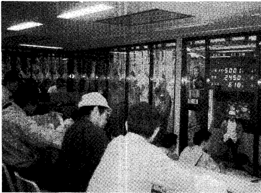
〈경매실 내부에 앉아서 쾌적한 환경속에 경매에 임하는 장면〉

경매는 牛, 豚 공히 1두씩 한다. 돼지경매는 매일 있으며, 소 경매는 주1회(월요일) 실시한다.