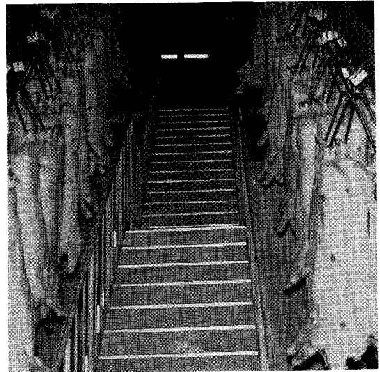
〈지동레일을 이용해 경매장으로 돈도체를 이동시키는 장면〉