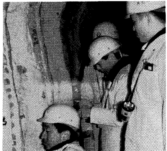
〈완벽하게 설치된 냉장실에서 우도체를 등급판정 하는 장면〉

등급판정은 등급사 2명이 냉장고내에서 6~7 늑골사이의 잘린 단면을 랜턴으로 비추어보고 판 정하며, 이때 육량지수를 함께 산출하여 1차등급 을 결정한다. 다시 약2시간후에 육질등급 및 기 타 하자여부 등을 재검사하여 최종등급을 결정한 후 등급인을 날인한다.