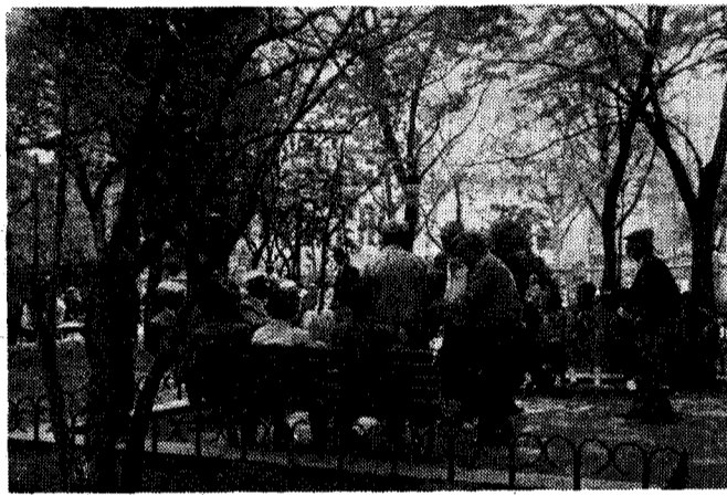
◇우리가 노인하면 연상되는 모습의 대부분이 신경계의 변화로 온다.

나 사회생활에 장애를 일으킬 정도로 심할때 이를 병적인 것으로 간주하게 되고, 치매가 있는 것으로 판단하게 된다. 이때 치매는 여러가지 급성질환에서 나타날 수 있는 의식혼돈 상태와는 구별되어야 하며, 출생시부터 지능이 낮은 정신지체와도 구별되어야 한다.