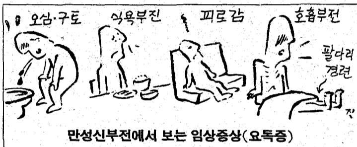
만성신부전에서 보는 임상증상(요독증)

여러 증상들이 조금씩 나타난다. 대개는 본인이 이들을 인지하지 못하고 지내지만, 의사가 자세히 물어보면 알게되는 경우가 있다. 즉 밤에 일어나 오줌을 누게된다(이는 다른 이유로 일어나서 소변보는 것이 아니라 뇨의(尿