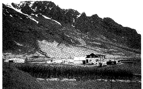
레카빅 근교의 해안가 언덕에 위치해 있는 산란계 농장 전경

북위 65도에 위치해 있는 아이슬랜드는 총 인구 25만5천명의 절반이 수도인 레카빅 주위에 모여살고 있는데 1인당 계란 소비량이 205개 닭고기 소비량이 6.1kg에 달한다.