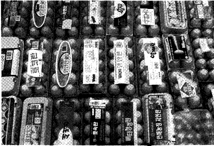
▲국내에 유통되는 각종 상표란-소비자들에게 혼란을 주어 오히려 소비위축을 가져온다는 지적도 나오고 있다.