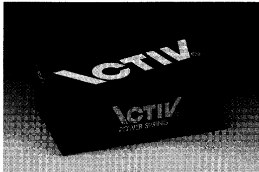
▲ 모던함과 심플함으로 국제적인 감각을 살린 액티브 포장디자인

이처럼 진취적인 ‘그린디자인연구소’가 최근 진행하는 작품은 차천지의 ‘작설차’ 포장디자인인데 고품질 제품의 특성을 살리는데 중점을 두고 지기구조부터 캔, 외형, 지판, 선물 세트 등 전부분의 BI를 진행중이다. 이 디자인은 ‘그린디자인연구소’의 전략적 크리에이티브에 따라 포장 구조, 디자인, 회사명 등을 개선한 예로 일괄적으로 디자인의 과정을 진행함으로써 그 회사와 제품에 맞는 디자인의 개발에 힘쓰고 있다. 또한 전통차이니만큼 전통적인 이미지를