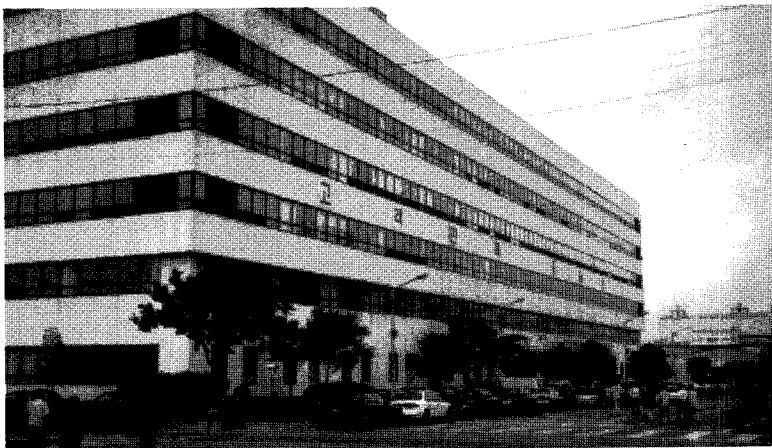
▲ 삼성전자 수원공장내 품질경영센터 전경. 1층에 포장연구소가 있다.

제품제조 과정에서 실질적인 포장과 이론적인 포장의 갭이 약간씩 발생하는데 이것을 최대한 줄이기 위한 연구와 컴퓨터 시뮬레이션을 통해 여러번의 시험을 거치지 않고 여러방도로 제품을 응용해 경비절감의 효과도