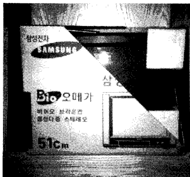
▲ 삼성전자가 필름몰드와 코러퍼드를 적용한 가전제품 포장

현재 지적되고 있는 문제는 전자 각사마다 제품의 규격이 제각기 다른데 어떤 제품, 어느 부분에 어느 정도의 포장재를 사용하는 것이 가