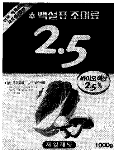
◀ 조미료 2.5