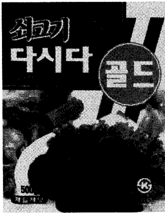
▲ 쇠고기 다시다