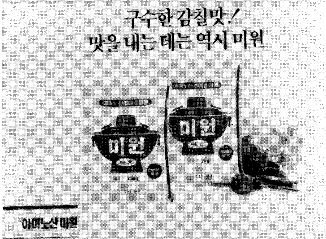
(사진1) ▲ MSG가 99.9%이상인 미원