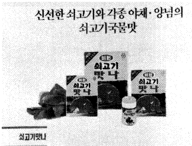
(사진3) ▲ 국내 최초로 KS마크 획득