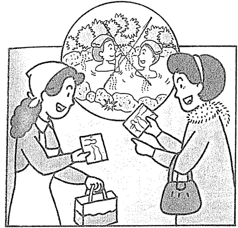
단골손님 만들기는 친구를 사귀는 것과 같다.

앞에서 설명했듯이 손님의 이름을 기억하는 것이 단골손님을 만드는 첫걸음이다.