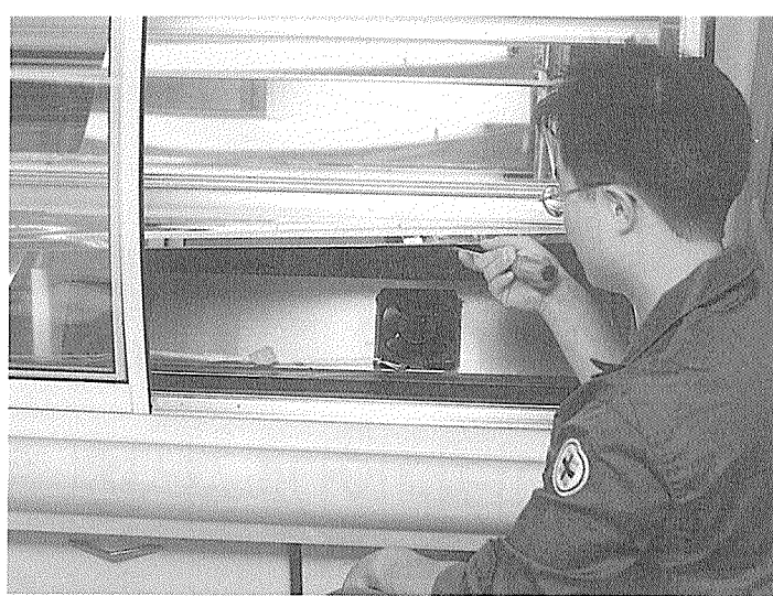
냉기가 잘 흐르지 않을 때 내부 밀판을 열고 얼음을 채운 후 팬을 가동하면 하루 정도 견딜 수 있다.