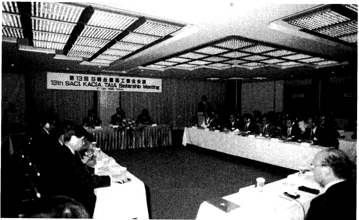
제13회 韓日臺 농약공업협회 회의가 지난 10월 27일 일본 동경의 경단련 회관에서 개최됐다.

한국 일본 대만의 농약업계 인 사들이 한자리에 모여 농업 및 농 약산업의 현안문제를 논의하고 관 련정보를 교환함으로써 농약산업 의 건전한 발전에 기여하기 위한 「제13회 한국 일본 대만 3국 농약 협회 자매회의」가 지난 10월 27 일 일본 동경에 있는 經團聯회관