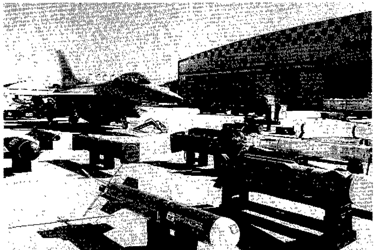
한국형 F-16에는 AMRAAM 등 공대공 미사일과 HARPOON 등 공대지미사일을 무장할 수 있도록 개량되었다

F-16은 초기기종인 A/B형과 후기기종의 C/D형이 있는데 A형과 C형은 단좌형, B형과 D형은 복좌형이다. 초기형과 후기형 간에는 외형상의 차이는 크지 않지만 탑재엔진과 조종 및 무장에서는 현격한 차이가 있다. 이렇게 동기간에 성능차이가 크게 나는것은 다단계개발계획(MSIP)에 의해 체계적인 성능개량을 추진한 결과인데 새로 개발된 장비는 신기종 뿐만아니라 구형기종에도 장착될수 있도록 배려했다. 이러한 단계별 성능개량에 따라 생산 항공기의 불력이 바뀌는데 KFP 기종