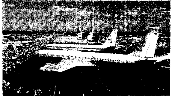
공중급유용 탱커기. 보잉 707개조형이 보인다

에서도 취역기가 아주 최소한 기종으로 아마 수년후면 이곳에서 볼 수 없게 될것같았다.