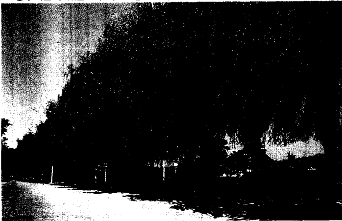
▼ 능수버들이 있는 길, 수원 농과대학 정문 앞, 1975. 10. 5

버드나무속의 나무는 특히 물이 있는 땅을 좋아하는데 어느정도 축축한 땅에 열매가 떨어지면 이내 싹이 트고 자라기 시작한다. 24시간이내에 열매는 어린 새싹으로 변하고 성큼 자라서 위로 올라간다. 햇빛을 좋아하는 나무들인데, 저장양료가 적다보니 빨리 광