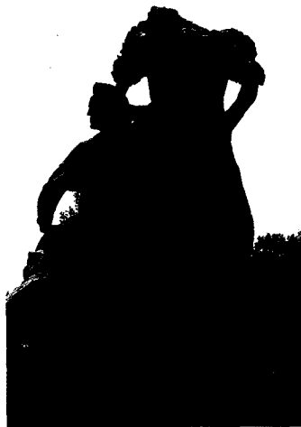
▲능수버들 아래에 앉아있는 쇼팽. 폴 란드. 바르샤바. 1990. 10. 6.

무가지는 아름다운 음악의 선을 그것이였기에 그렇지 않았을까 하는 생각도 해 보았다.