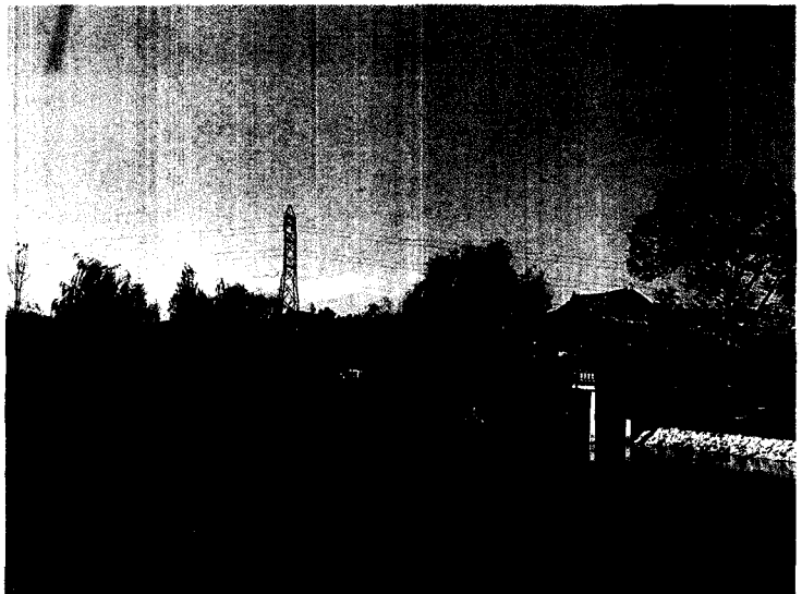
▼ 천안삼거리의 능수버들. 1976. 11. 7.