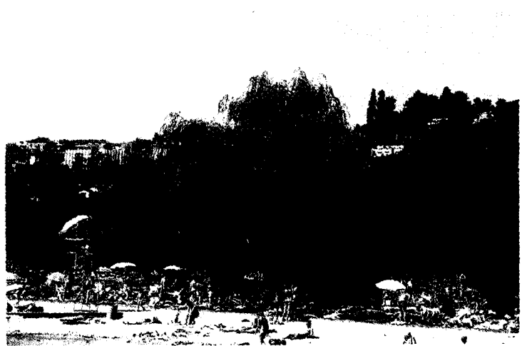
▲스위스 로잔노호반의 능수버들. 1988. 8. 15

능수버들은 수류(垂柳)로 쓰고 수양버들은 수양(垂楊)으로 쓴다. 류(柳)는 음이 류(流)에 통해서 가지가 처진다는 뜻을 담고 있고 양(楊)은 음이 양(揚)에 통해서 가지가 위로 서는 양(楊)임을 뜻하고 있다. 훈몽자회(訓蒙字會)라는 책을 보면 양기자(楊起