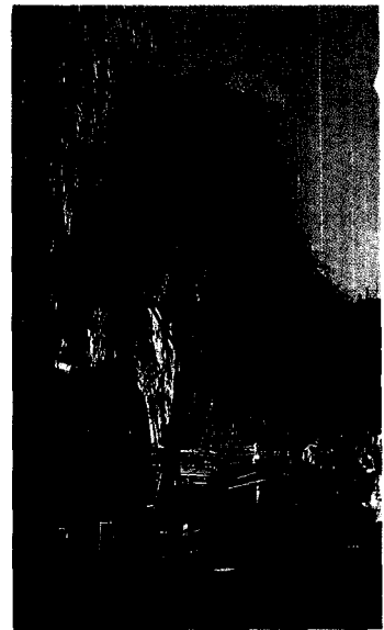
▲도오교 메구로의 능수버들, 1973. 9. 21.