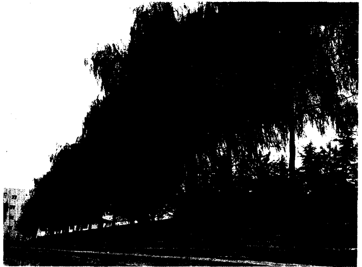
▲ 능수버들, 원광대학교 운동장 주변, 1988. 10. 6.

필자는 이 대목에 대한 풀이를 할만한 지식을 가지지 못하고 있어서 유감이나 얼룩지게 껍질이 벗겨진 버드나무가지를 보고 양들이 얼룩진 양을 생산했다는 극히 표면적인 해석을 한다면 이것은 환경감응(環境感應)의 초능력적인 힘을 생각할 수 있지 않을까. 어느때인가 기회가 오면 이부분에 대한 종교적(?)인 해석을 들