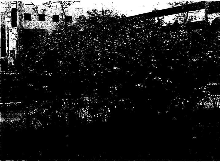
▲개화지속기간이 23일인 홑꽃인 황매화