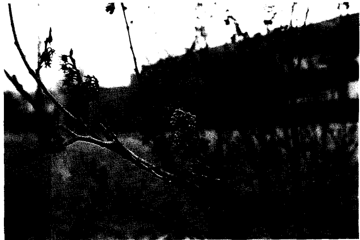
▲1년중 제일 먼저 개화하는 풍년화

조사대상 163수종의 개화특성을 조사한 결과 맨 먼저 개화한 것은 풍년화로 개화일이 2월 24일이었으며, 가장 늦게 개화한 수종은 나무수국으로서 8월 7일에 개화하였다. 표 1은 개화수종을 월별로 분류한 것이다. 2월에 개화하는 수종은 1수종(0.6%)이었으며 3월에 개화하는 수종은 15수종(9.2%), 4월에 개화하는 수종은 48수종(29.5%), 5월에 개화하는 수종은 63수종(38.7%), 6월에 개