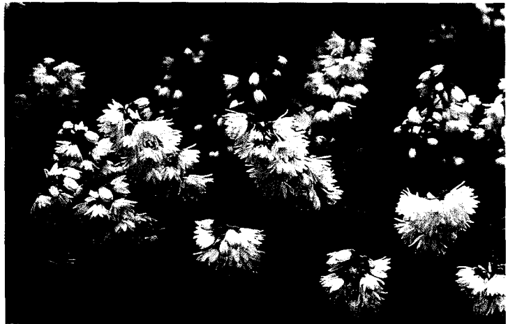
▲6월에 개화하는 꽃말발도리

6월에 개화한 수종은 얼룩인동덩굴, 산가막살나무, 감나무, 장미, 나래쪽동백, 고평나무, 쥐똥