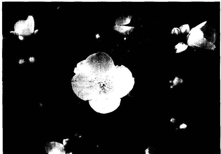
▼6월에 개화하는 고평나무