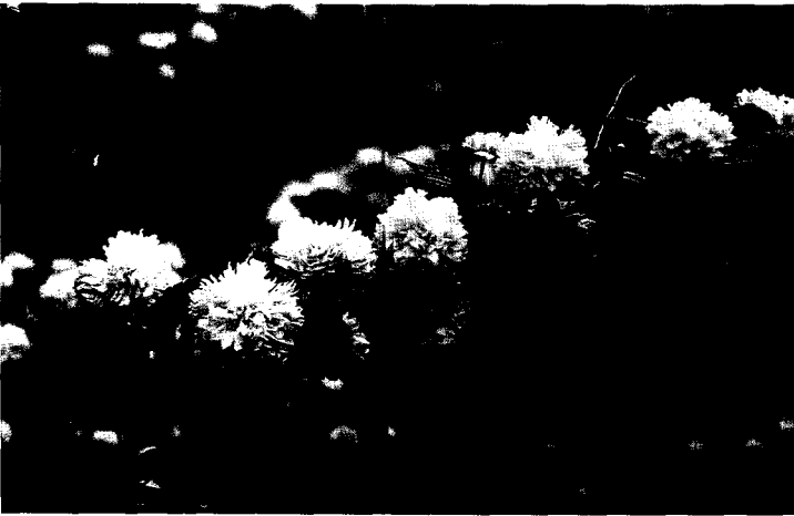
▲개화지속기간이 32일로 홑꽃인 황매화보다 9일 정도 더 긴 겹꽃인 죽단화