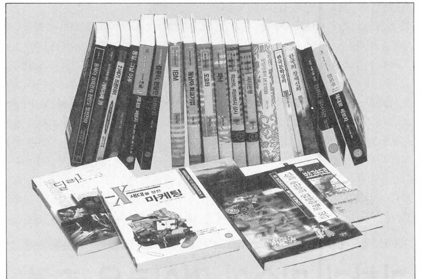
길벗 출판사에서 펴낸 책들.

기의 프론티어》등 나라정책연구회의 ‘나라총서’ 외에도 세계 일류기업들의 내부를 현미경으로 들여다보듯이 꼼꼼하게 살펴 성공요인을 분석한 ‘세계일류기업총서’는 아직 누구도 다루지 못한 주제이며, 연구실이나 기업체 등에 파묻혀 있던 필자들을 발굴, 편집자와 필자가 함께 고민하고 격려하며 이루어낸 성과들이다.