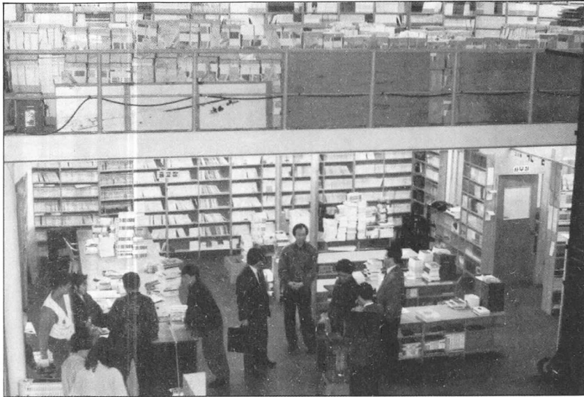
경남 창원에 있는 경남도서유통에 삼삼오오 모여든 출판영업인들.

—사실이다. 남자들보다 몸이 약하기 때문에 불리한 점이 적지 않다. 또 남자들이 스스럼없이 여관잠을 자는 것도 한편으로는 부럽다. 나의 경우 호남지역 출장은 집에서 출퇴근을 하고, 영남지역은 대구의 친척집에서 잠을 잔다.