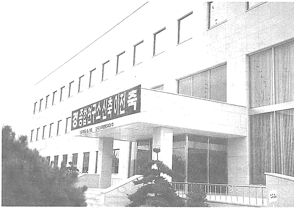
지난6월16일 기흥으로 신 축, 이전한 한 국야쿠르트 연 구소 전경