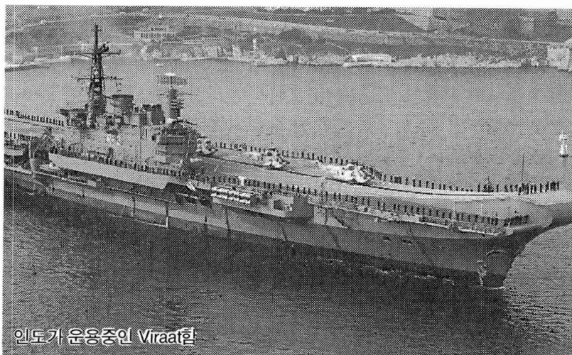
인도가 운용중인 Viraat함