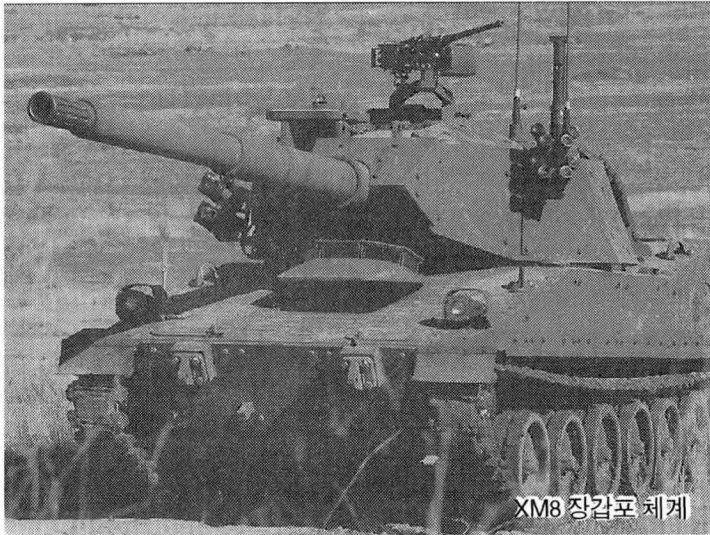
XM8 장갑포 체계