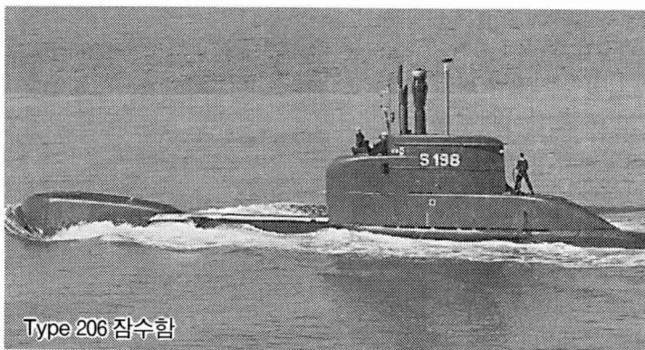
Type 206 잠수함

독일 국방장관에 의하면, 연방 안보위원회가 이 거래를 이미 승인했으며, 싱가포르를 우선 Type 206 1척을 인도 받은 후 2척 또는 3척을 후속구매할 계획이라고 한다.