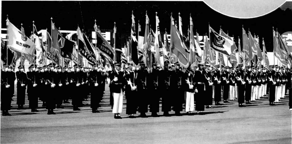
▲ 막강 국군의 위용을 나타내는 국군 기수단의 모습