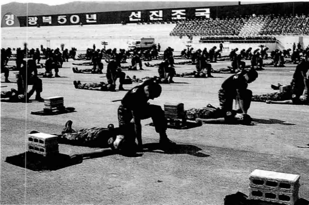
◀ 태권도를 기초로 하여 발전시킨 특공무술

이날 행사는 각군 의장대 시범, 기념식, 각군 부대 열병, 특공 무술, 고공강하, 각군 부대 분열, 전투기 편대비행 및 공중분열 등의 순으로 진행되었다.