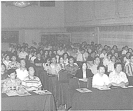
'95, 직원 연수 교육에 참가해 교육을 받고 있는 직원들

한국건강관리협회는 '95년도 직원 연수교육을 지난 7월 10일부터 15일까지 강원도 속초의 설악산에서 실시했다.