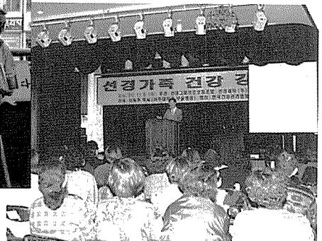
▲ 건협 경기지부는 지난 11월 9일, 선경 직원 가족을 대상으로 건강강좌를 실시했다.