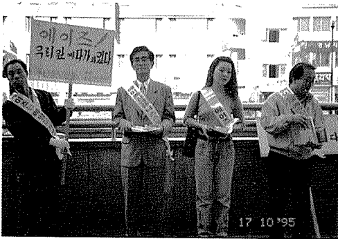
▲ 건협 경남지부는 지난 10월 17일, 마산시 외버스터미널에서 에이즈 예방 캠페인을 전개했다.