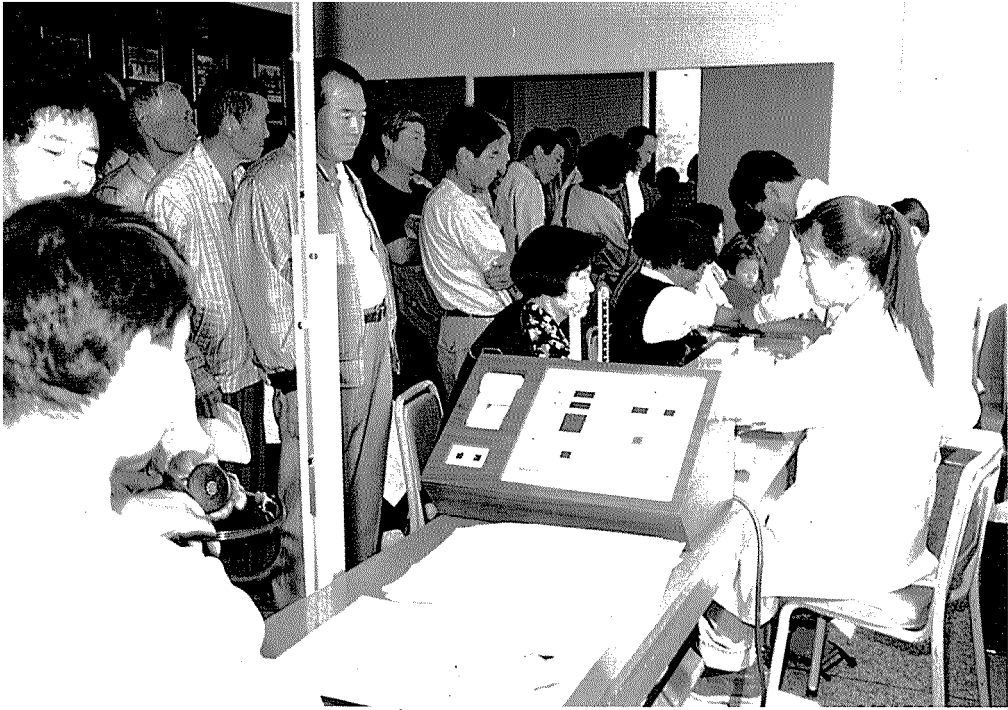
▲ 건협 경북지부가 관내 지역의료보험조합원에 대한 성인병 무료 순회 검진을 실시하고 있다.(사진은 지난 10월 11일 칠곡군 군민회관에서 있었던 칠곡군 의보조합 순회검사 광경)