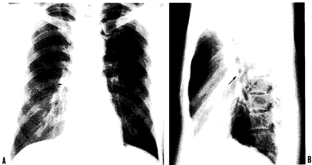
Fig. 1. A,B) The simple chest X-ray(PA & lateral) showed a metallic pushpin(arrow) in the right middle lung field.

기도 및 기관지이물은 주로 이비인후과에서 자주 접하는 질환으로 성인보다는 소아에서 많이 발생한다. 기도이물의 발생원인은 대부분 부주의로 인한 것이며 1) , 유소아의 경우는 섭식중 또는 장난감을 입에 물고 있다가 발생하는 경우가 대부분이다. 성인의 경우는 의식불명등과 같은 상태에서 불수의적인 이물흡입에 의해 많