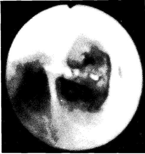
Fig. 2. Bronchoscopic findings showed pushpin in the orifice of right lower lobar bronchus.