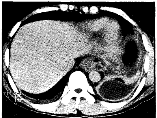
Fig 2. Chest CT scan showed both pleural effusions and fistula around esophageal hiatus. (arrow site)