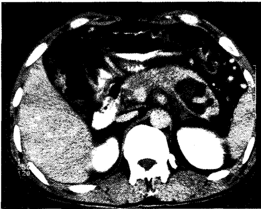
Fig 4. Follow-up chest radiograph obtained 20 days after treatment showed mild left side left fusions.