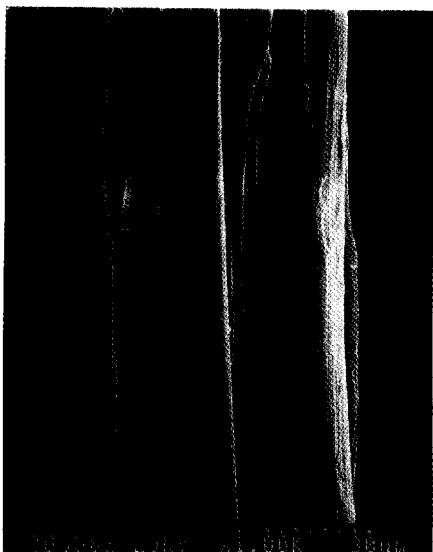
Fig. 1. SEM micrograph of unsoaked raw silk.