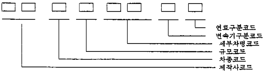
그림 3 자동차코드 체계도

그리고 지역별 자동차 보유지표는 통계청의 총조사인구 전산자료와 통합 자동차 등록통계와 연계하여 시도별 시군구별로 자동차 1대당 인구