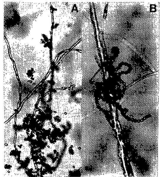
Fig. 2. Micrographs of conidia and conidiophores Beauveria sp (A) and Paecilomyces sp. (B) isolated from soil.