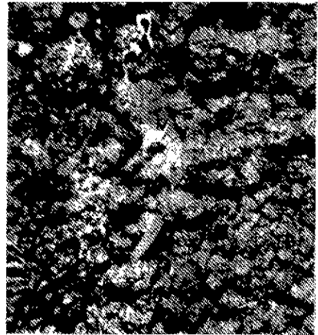
Fig. 1. Infected larva of Thecodiplosis japonensis with Beauveria sp. isolated from the soil.

분리된 곤충병원 사상균의 동정은 먼저 colony의 형태 및 색깔별로 1차 screening하고, 위상차 현미경으로 형태를 관찰하였으며(Fig. 2), 또 주사전자현미경을 이용하여 분생자와 분생자병에 분생자의 부