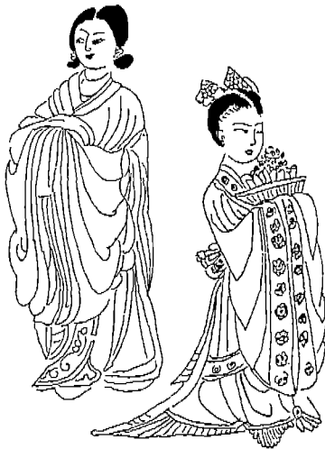
〈도 7〉 궁중여관복식

불설예수 10왕생 7경 대왕 앞의 여시 혹은 주악, 주선동자 양이하 쌍계 혹은 보주식 쌍계, 대수(무릎길이) 속대, 장군 착용