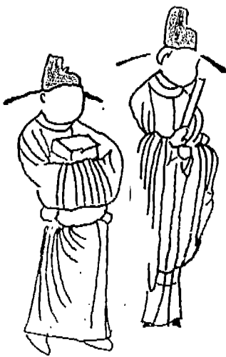
<도 3> 남자복식(2)(관직자 복식)

고종 36년(1249) 제작 ‘불설예수 10왕생7경’ 판관 빛 사자, 전각복두, 착수 혹은 대수 단령포, 양개차 혹은 슬란포, 속대, 집홀, 혹은 집공 양물.