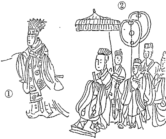
<도 2> 남자복식(1)(왕실 귀족 복식)