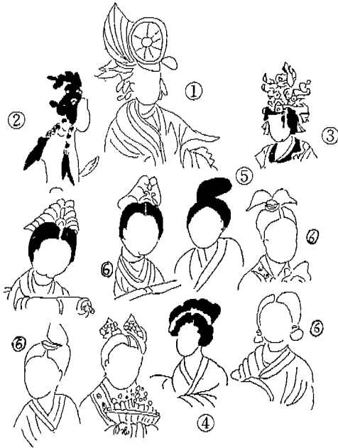
<도 5> 여자발양 및 두식