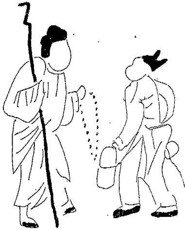
〈도 4〉 남자복식(3)(평서민복식) ‘어제 비장전’관화 소재, 평서민, 신, 원령 착수, 소구고, 속대, 혜 착용