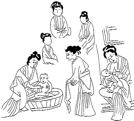
〈도 8〉 평서민여복식

불설예수 10왕생 7경 대왕 앞의 여시 혹은 주악, 주선동자 양이하 쌍계 혹은 보주식 쌍계, 대수(무릎길이) 속대, 장군 착용