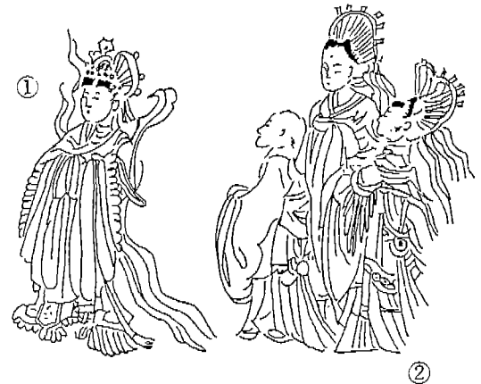
<도 6> 여자복식(왕실 비빈복식)

① 문식, 단식, 교령의 대수상의, (상의는 무릎 길이). 내하의로 착용한 장군의 아랫도리에는 잔