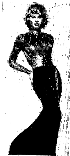
〈사진 13〉 ELLE, 1994년 8월, p.146.

〈사진 13〉은 현대의 가장 글래머러스(Glamorous)한 모델로서 알려진 Eva Herzigova가 입은 세킨 바디 슈트와 벨벳 스커트이다. 몸의 곡선을 의상으로 밀착시켜 대혹적인 여성의 곡선미를 보여주고 있다. 미들힙에 걸친 스커트는 전체적으로 보아 노출은 없는 듯하나 허리에는 끈으로 처리되어 있어 쉽게 풀어 질수 있는 의미가 포함되어 에로티시즘의 의미를 가지고 있다.