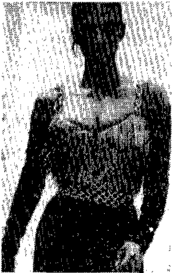
〈사진 18〉 Collections, 91S /S, p.109.

〈그림 19〉는 Jimmy Jumble Scarlet mirror slip dress이다. 50) 금속성의 찬 느낌과 반사에서 주는 소재의 느낌은 육체의 움직임에 따라서 반사되는 빛의 변화에 따라 육감적이며 환상적인 이미지를 전달한다. 또한 주홍색(Scarlet)은 에로티시즘과 밀접한 관련이 있는 색상으로 “나를 봐요” 그리고 “나를 가지세요”라는 의미를 지니며 전통적으로 공격성과 성적욕망을 상징한다. 또한 슬립 형태의 디자인과 망사 스타킹에서 주는 섹시함과 모델의 표정과 포즈는 더욱 선정적인 느낌을 전달하며 더욱 에로티시즘을 증가시키고 있다.