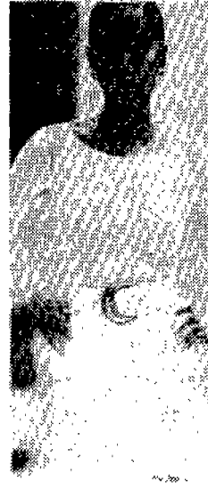
<사진 5> Collections, 91S/S, p.179

또한 신체가 노출된 의상은 급진적 페미니즘이 표방하는 여성의 신체적 특징과 심리적 특성 그리고 생리적 기능이 남성보다 결코 열등한 위치에 있지 않다고 하는 자신감있는 표현으로도 유행하게 된다. 32) <사진 5>와 같은 의상에서의 가슴 투영