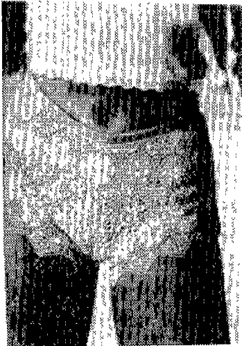
〈사진 9〉 ELLE, 1994년 4월, p.173

1990년대의 Deshabille Style의 대표적인 디자이너인 Karl Lagerfeld는 부스티에(Bustier)로써 언더콜셋을 겹옷으로 하는 파격적이고 대담한 스타일을 보여 주었다. 37 과도한 노출 뿐아니라 육체적인 미를 선정적으로 표현해 주고 있다. 〈사진 10〉은 Ungaro의 화려한 장식을 한 원더콜셋으로 여성스러운 매력을 돋보이게 하고 있다. 가슴을 부풀리고 허리를 편 의상이 육체적인 아름다움을 나타내고 있다.