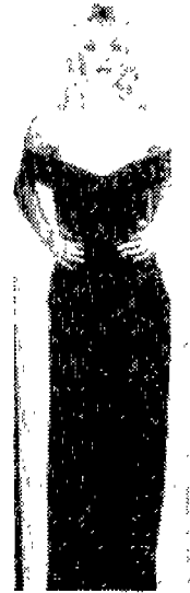
〈사진 14〉 WWD(한국), 1994년 9월, p.102.

함되어 있는데 반해, 이러한 심플한 디자인은 스스로 즐기려는 쾌락주의적 사고가 내포되어 있다고 볼 수 있다.