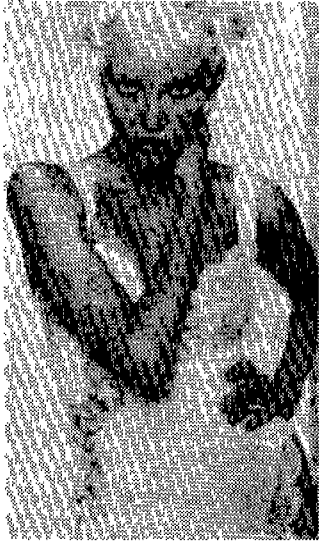
〈사진 8〉 Vogue(U.S.A), 1993년 12월, p.268

츠의 짧은 길이와 배꼽의 노출로 더욱 속옷과의 구분이 되지 않을 만큼 자극적인 디자인이다. 이러한 슬립이나 팬츠, 레이스 브라, 캐미솔등과 같은 속옷이 걸맞은 의상은 밤의 환상을 직접적으로 자극하는 에로틱함을 나타내고 있다.