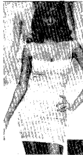
〈사진 17〉 TORONTO life Fashion, 1995년 5월, p.28.

〈사진 17〉은 Herve Leger의 작품으로 마치 인체를 봉대로 묶어 놓은 것 같은 디자인은 억압된 인체에서 매저키즘 46) 적인 경향을 볼 수 있다. 이는 압박의 고통에서 즐거움을 유도할 뿐 아니라 자유에의 욕구를 즐길 수 있고 또한 조여지는 의상으로 인해 오히려 더욱 풍만해 보이는 가슴선에 에로티시즘을 강조하려는 의도가 느껴진다.