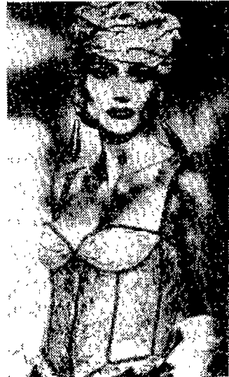
〈사진 10〉 WWD(한국), 1994년 10월, p.109