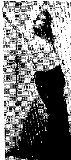
〈사진 22〉 Fashion Today, 1995년 4월, p. 66.

로 파코라반의 환상적인 디자인의 한 예이다. 파코라반은 의상은 “옷을 길게 입는 것은 불안해진 실업자가 많이 생기고 전쟁을 뜻하며, 노출을 많이 하는 것은 이런 불안감을 없애고 성적 욕구가