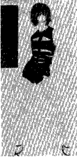
〈사진 6〉 Vogue(U.S.A), 1995년 5월, p.328