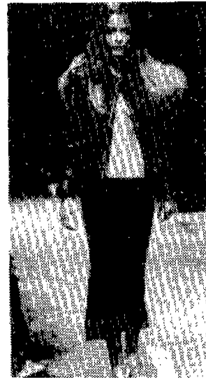
〈사진 3〉 Collections, 95S / S, p.35

〈사진 3〉은 Alexander McQueen의 95년 런던 컬렉션에서 발표한 작품으로 신체의 노출을 극단적으로 표현함으로써 거리의 반항아 같은 의미를 주고 있다. 즉 아슬 아슬하게 걸쳐진 미들헵의 스커트와 오픈된 자켓에서 보여지는 가슴의 대담한 노출은 섹시하면서도 인간의 성적인 내면적 욕구 표현이라고도 할 수 있다. 1960년대에 최초로 소개되었던 미니, 핫팬츠, 토폴이스등 노출이 심한 의상이 대중의 호응을 받았던 이유는 젊은 세대의 급부상과 기성세대에 대한 심리적인 반발이