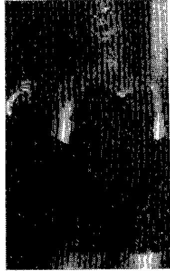
〈사진 12〉 Fashion of a Decade the 1990s, 1992, p.18.

Glamour Style의 특징은 인체의 곡선을 살려 디자인하며 특히 풍만한 가슴과 엉덩이, 잘록한 허리선을 강조한 관능적인 형태로써 주로 실크나 벨벳 등 고급화된 옷감을 사용하여 여성스러움을 강조함으로써 에로티시즘을 표현하는 스타일이다. 최근 디자이너들에 의해 자주 등장되고 있는 글래머 스타일은 과거 1930, 40년대의 품미했던 글래머 스타일이 구조적 특징은 비슷하지만 모르지만 현재의 분위기는 93년이래 디자이너들이 가장 깊숙하게 자리하고 있는 반항문화에 깊이 침윤되어 있다. 뿐만아니라 글래머 스타일은 성개방 문화에 힘입은 페미니즘적 사고방식 뿐아니라 남에게 보여주기 위한 美보다는 스스로 즐기려는 41) 쾌락주의적 사고방식 즉 나르시즘(Narcissism: 자기도취)에서 왔다고 본다. 또한 최근 헐리우드 패션의 대두로 인한 글래머 스타일은 더욱 의미가 보편화되고 있으며 1990년대에 의상의 특징으로서 에로티시즘을 형성하게 하고 있다. Donna Karan은 “의문의 여지없이 현대 여성들은 섹시하고 글래머로 보이길 원한다. 그들은 구조적인 옷을 원하는