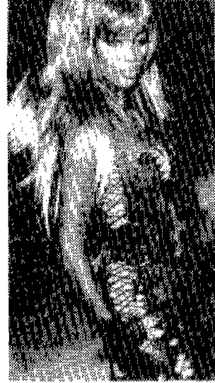
〈사진 21〉 Fashion of a Decade the 1990s, 1992, p. 15.

〈사진 22〉는 Paco Rabann의 차가운 느낌의 메탈 브레지어, 옷을 대신하는 커다란 금속 목걸이