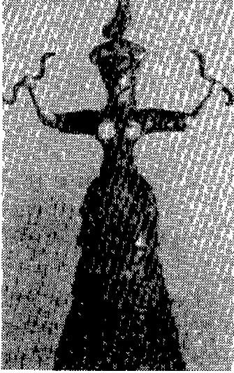
〈사진 1〉 백영자, 서양복식문화사, 1989

이러한 노출이 나타나는 원인 중에 하나는 인간이 갖고 있는 표현욕구나 이성에게 매력적으로 보이기 위한 욕구를 충족시키기 위하여 의복의 노출을 사용한다. 특히 중세 이후로 부터 노출은 인간 내면의 소리에 귀를 기울이며 여성미의 표현이나 인체의 장식적 요소로서 그 위치를 바꾸게 되었고 에로티시즘을 대변하게 되었다. 9) 근대를 거쳐 현대에 이르기까지 인간성 회복의 성적 매력 표현으로 어느 시기보다 활발하게 전개 되었으며 초현실주의자에 의해 성적 해방을 위한 투쟁, 욕망의 상징으로 표현되었다. 1960년대 팝 아트는 또 한번의 큰 변화를 가지고 상업적인 에로티시즘을 보이면서 도덕적 관념에 대해 반발했고, 1980년대의 포스트모더니즘은 성 개방과 대중화를 요구했다.