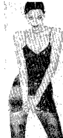
〈사진 19〉 Vogue(BRITISH), 1994년 6월, p.185.