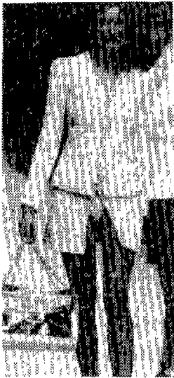
〈사진 7〉 Collections, 95S /S, p.7

의 직접적인 연상으로 연결될 수 있다. 인체부위 중 은폐의 부위로써 늘 인식되어 오던 치부의 간접적인 노출은 선정적이다. 정신분석에서는 호기심 있는 행동 그 자체가 성적인 뿌리를 갖고 있다