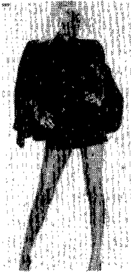
<사진 4> Vogue(U.S.A), 1994년 5월, p.245

1990년대의 영 패션의 대두는 섹시 스타일의 경향을 구체화하고 있으며 <사진 4>에서와 같은 대담한 다리의 노출은 다리 중 가장 상부 다리의 안쪽은 피부가 가장 부드럽고 민감하며 특히 허벅지 부위의 노출로 성기의 노출을 즉각 연상시킨다. 31) 반면 강렬한 표정과 여성의 성개념의 변혁으로 나약함 보다는 도전적이며, 강력한 여성으로써의 의미를 보여 주고 있다.