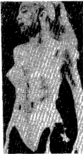
<사진 2> Madonna, dressed by Gaultier. Fashion of a Decade the 1990s, 1992, p.28

봄은 이전에 재활용된 패션이나 음악과 함께 계속되었고 라틴 아메리카와 아프리카의 뮤직으로부터 웨이트런 댄스까지 활기있게 계속되고 있으며 스타일이 무엇이든 간에 댄스 음악은 강조되고 있다. 청소년들은 솔직한 자기의 표현을 아끼지 않으며, 평범한 분위기 보다는 튀는 듯한 행동이나 언어를 즐겨쓰는 풍조는 음악과 함께 표현될 수 있었다. 이것은 의상에서 최소한 브라-탑(Bra-tops)과 스트레치 페브릭(Stretch fabric), 캣슈트(Catsuit)등에 영향을 주었다. 22) 마돈나는 이러한 브라-탑과 콜셋의 의상을 <사진 2> 무대에 올려 놓기도 했다. 현대에 있어 신체의 표현은 주로 인간의 위기와 같은 사회문제를 주로 모티브하기 때문에 신체의 적나라한 표현이 일반적인 현상이기도 하다.