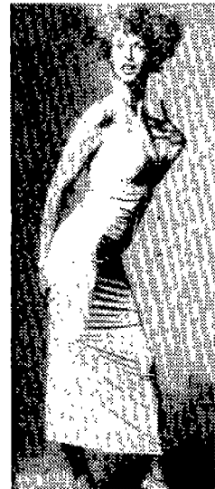
〈사진 15〉 Vogue(U.S.A.), 1994년 4월, p.213.