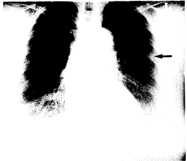
Fig. 1. Histiocytoma. Chest PA showing tumor mass of soft tissue density on left 3rd rib.

악성종양인 3례에서는 광범위절제후 항암화학요법을 시행하였고 흉골에 발생한 악성종양에서는 광범위절제술과 방사선치료를 실시하였다.