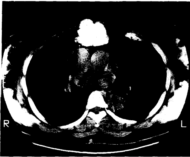
Fig. 2. Hemangioma. Chest CT showing popcorn-like, calcified, protrudent tumor mass on sternum.

환자이며, 흉부단층 사진에서 흉골을 파괴시키는 연부조직 종양이 보이고 있다(Fig. 7). 이 환자는 종양 적출술후 방사선 치료를 받고 외래 관찰중이다.