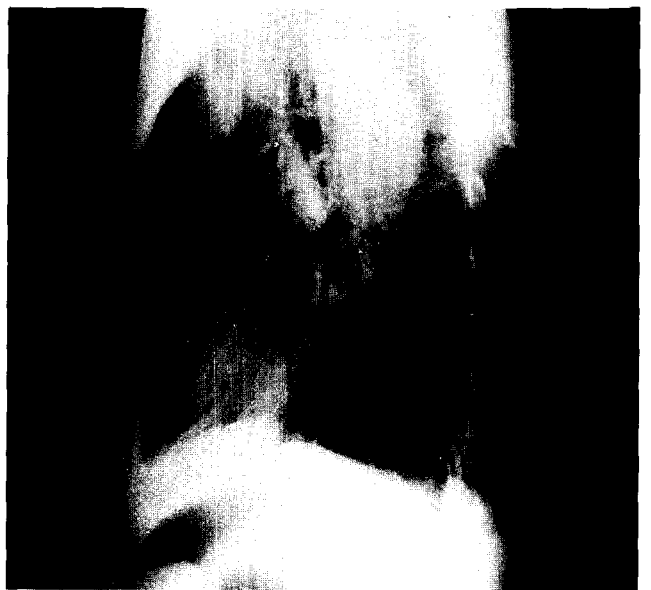
Fig. 3, 4. Fibrous Dysplasia. Chest PA and Lateral view showing soft tissue density tumor mass on left thoracic wall. A) B)

면에 Vogt-Myokoph 6) 등은 악성종양이 양성종양의 50% 미만이라고 보고하였다.